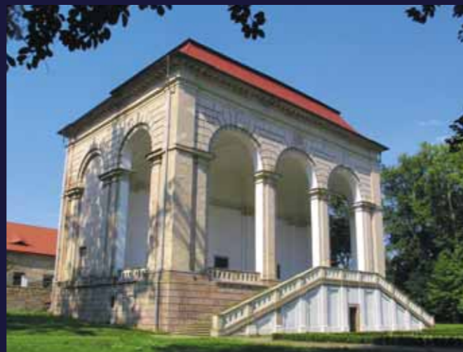
Valdštejnská lodžie a park Libosad

Velkoryse pojatý areál letohrádku s lodžii a terasovitě členěnou zahradou, dnes zvanou Libosad (6), založil Albrecht z Valdštejna v roce 1634 na úpatí vrchu Zebín. Po jeho smrti význam ne zcela dostavěného letohrádku upadal. V 70. letech 18. století byly chátrající budovy přestavěny na byty a sklady; klasicistní podoba je výsledkem úprav provedených v roce 1813. Nyní prochází areál rozsáhlou rekonstrukcí. Pro svou romantickou atmosféru bývá letohrádek využíván pořadatelem různých kulturních akcí.