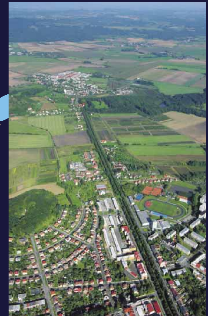
Při pohledu z ptačí perspektivy je patrná velkorysost kompozice.

Kostel sv. Jakuba Většího (3) nechal Albrecht z Valdštejna stavět od roku 1627 jako katedrálu budoucího jičínského biskupství, k jehož založení však nikdy nedošlo. Také z tohoto důvodu byla monumentální centrála na půdorysu řeckého kříže ve zjednodušené podobě dokončena o několik desetiletí později. Dostavba průčelí spadá až do druhé poloviny 19. století.