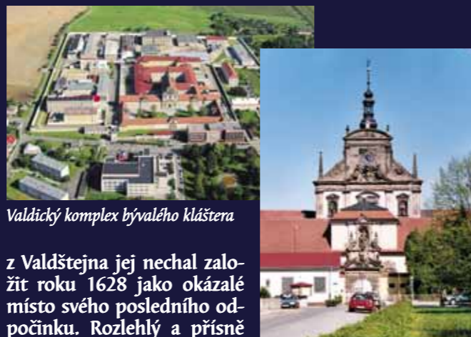
Valdický komplex bývalého kláštera

Krajinnou kompozici uzavírá komplex kartuziánského kláštera s kostelem sv. Josefa ve Valdčicích (7). Albrecht