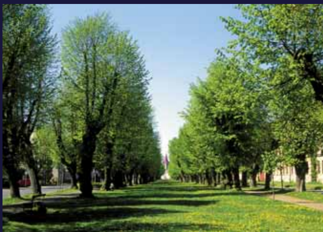
Osu kompozice tvoří lipová alej

Valdštejnovu městskou rezidenci s areálem zebínského letohrádku spojuje dnes stejně jako v roce 1632 dvacet a půl metru široká a 1716 metrů dlouhá lipová alej (5). Jen počet stromů, stojících ve čtyřech řadách, se zmenšil. Místo původních 1152 jich zde můžete napočítat necelých tisíc.