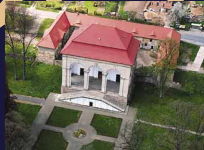
Areál s parkem Libosad

sáhlou dostavbu po osudném a nikdy zcela objasněném výbuchu střelného prachu v roce 1620 se však zasloužil Albrecht z Valdštejna. Dnes je palác sídlem několika institucí, z nichž pro návštěvníka nejvýznamnější jsou Regionální muzeum a galerie a Městské informační centrum.