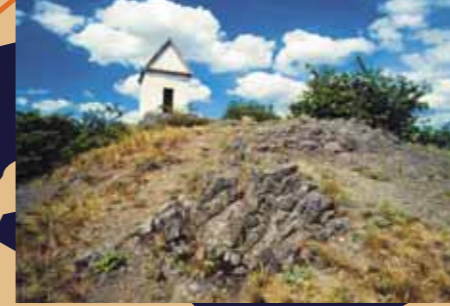
Vrch Zebín s kaplí sv. Máří Magdaleny