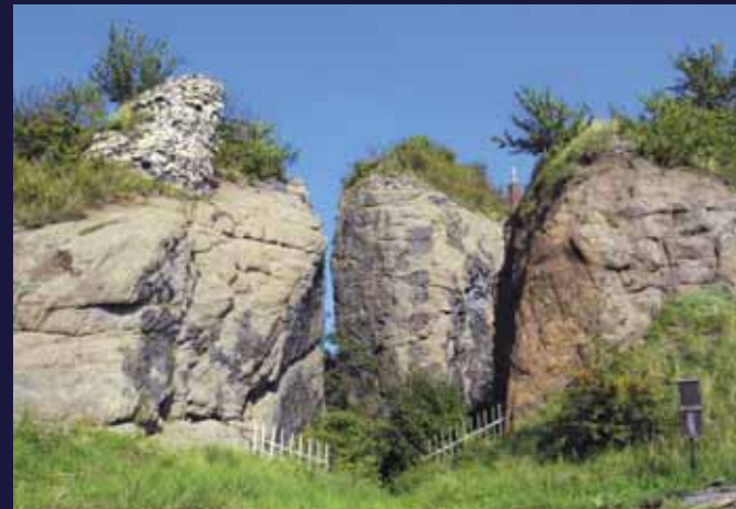
Zbytky hradu na vrchu Veliš