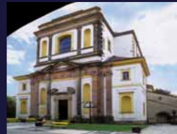
Interiér a exteriér kostela sv. Jakuba Většího

Nejvýše položeným místem krajinné kompozice je čedičový vrch Veliš (1), místo s nejkrásnějším výhledem na Jičín, Český ráj i Krkonoše. Na přelomu 12. a 13. století byl na jeho vrcholu vybudován hrad, jenž se na krátkou dobu stal také hlavním jičínským sídlem Albrechta z Valdštejna. Do dnešních dnů se z něj dochovaly pouze nepatrné zbytky obvodových