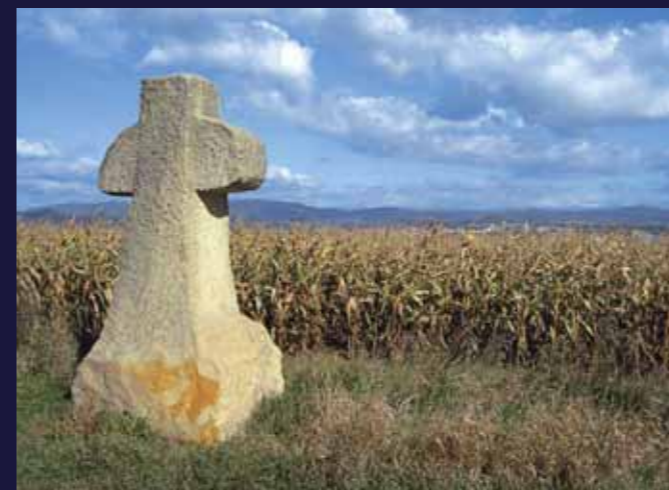
Smírčí kříž na úbočí vrchu Veliš

Raně barokní kompozice zhmotňuje v krajině mezi Velišem a Valdčicemi naplněné i nenaplněné mocenské ambice Albrechta z Valdštejna. Zrcadlí v sobě snahu vybudovat z Jičína suverénní sídelní město frýdlantského vévodství stejně jako Valdštejnovu energičnost, nezměrnou autoritativnost a neutuchající touhu vládnout. Touhu nashromáždit kolem sebe sílu, nezbytnou k určování běhu věcí pozemských a zároveň se těšit z přízně sil nebeských.