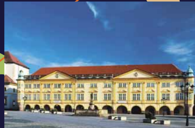
Valdštejnský palác v Jičíně

Postupné budování Valdštejnského paláce je spjato s významnými představiteli šlechtických rodů Trčků z Lípy a Smiřických. O obnovu a roz-